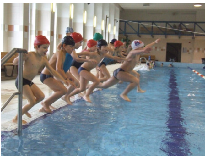
Élvezetes úszásoktatás a komlói fedett uszodában