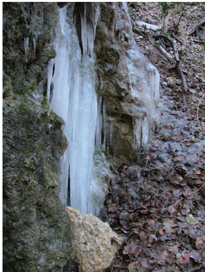
A Szuadó-völgy szikláin

Az erdővel való borítottság miatt a Nyugat-Mecseki Karszt úgynevezett fedett karszt. A nyílt karsztvidékkel ellentétben tehát a talajeróziót jelentősen gátolja az erdőállomány megléte, megakadályozva ezzel az esetleges szennyeződések közvetlen lejutását a barlangrendszerekbe.