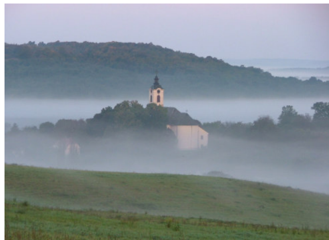
A páratlan szépségű völgy látképe

Országos jelentőségű védelmet nem élveznek, és tudomásom szerint az önkormányzat által fogantatható helyi védelem sem vonatkozik rájuk. Bár emlékeim között él egy régi tanulmány, ami e védettséget hivatott előkészíteni, de valószínűleg ez csak egy kezdeményezés maradt. Természetesen jogszabályi védelem nélkül is megőriz-