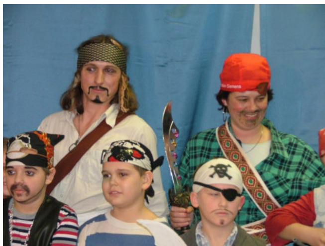
Jack Sparrow kalózkapitány és legénysége az iskolai farsangon

hattunk, mert február 14-én az alsósok a pécsi Harmadik Színházba látogattak, ahol a „Leánder és Lenszirom” című „szerelmes mesét” nézték meg, ami nagy sikert aratott. Ezen kívül egy komlói hegedűhangversenyre is ellátogattak azok, akik maguk is foglalkoznak zenéléssel iskolánkban.